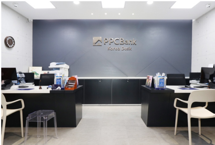
본점 한국 데스크