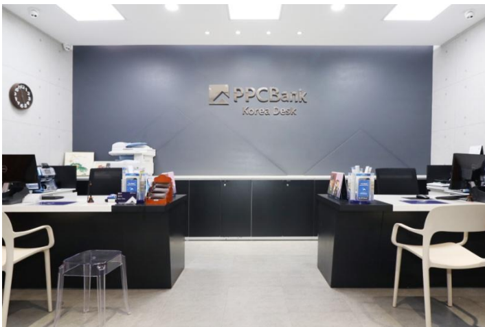
본점 한국 데스크