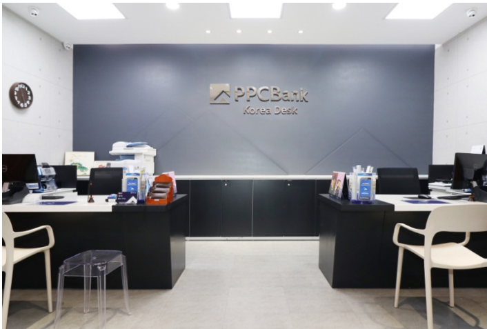
본점 한국 데스크