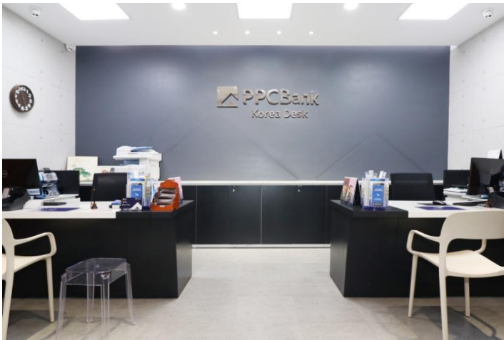
본점 한국 데스크